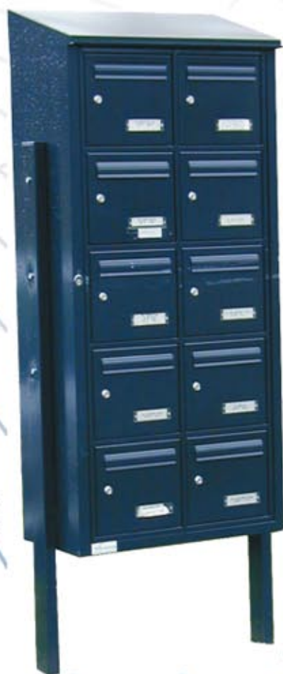
Module B10 sur poteaux