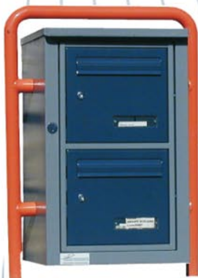
Module A2 sur portique