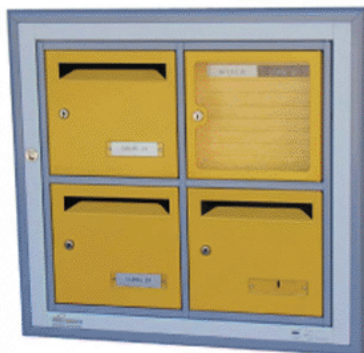
Module B4 encastré avec cornières d'encadrement